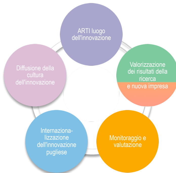
Figura 2 – Le linee di attività dell'ARTI

Di seguito si fornisce uno schema delle attività istituzionali : esse generano e sottendono progetti multidisciplinari generalmente affidati all'Agenzia dalla Regione o che l'Agenzia realizza quale partner di progetti europei.